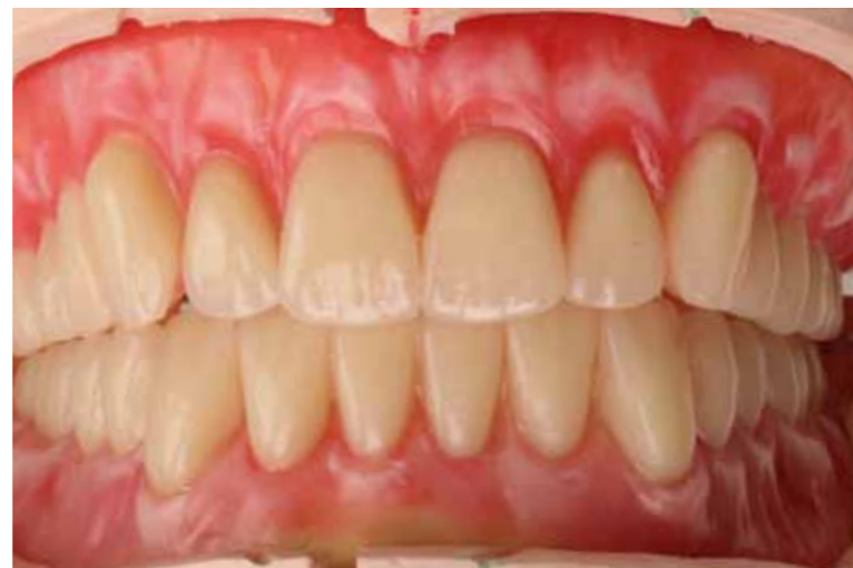
Les dents montées sur base en cire, lors de l'élaboration des prothèses