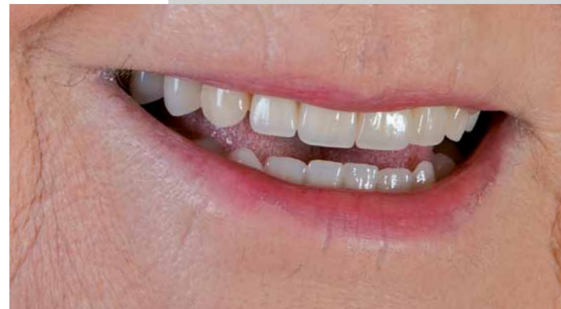
Un nouveau sourire très esthétique et lumineux