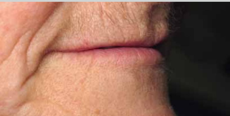
Un sourire "pincé", par manque de soutien des lèvres