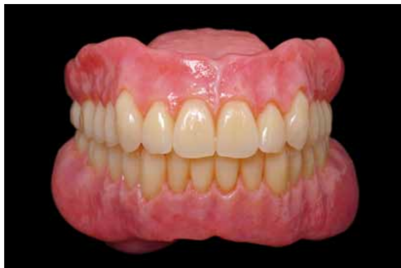
Les nouvelles prothèses. Une forme de dents plus féminine et un aspect beaucoup plus naturel des gencives personnalisées