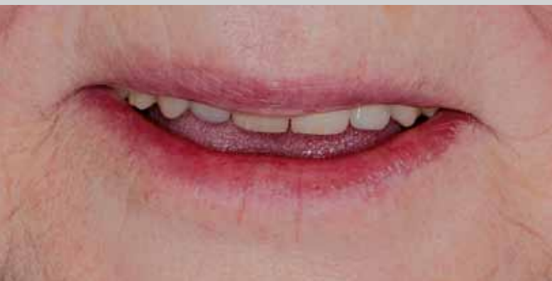
L'ancienne prothèse. La longueur et la visibilité des dents ne sont pas satisfaisantes