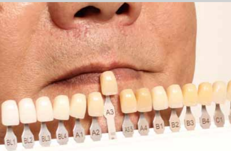
Choix de la teinte des dents adaptée au patient