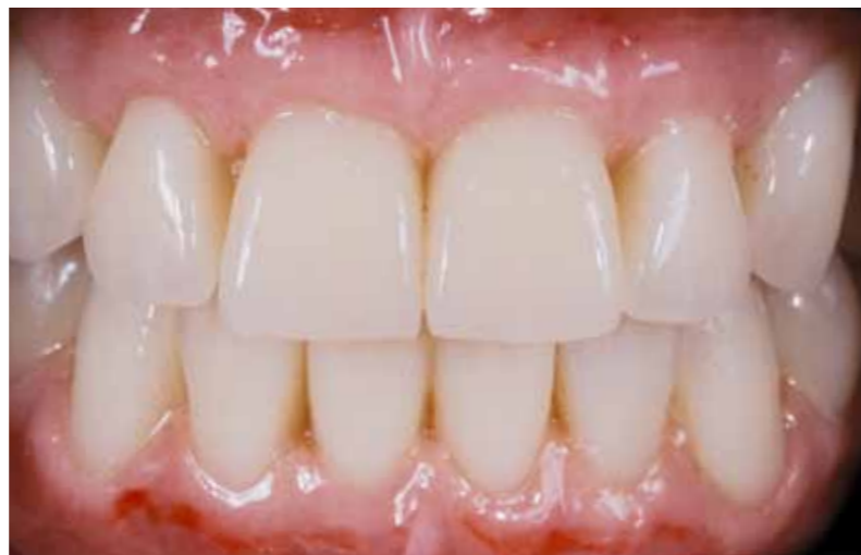
Des formes de dents adaptées à la personnalité de la patiente