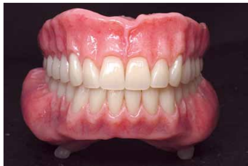
La gencive personnalisée contribue à l'aspect naturel des prothèses