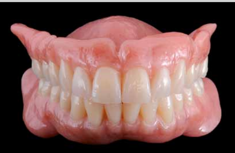
Les prothèses terminées