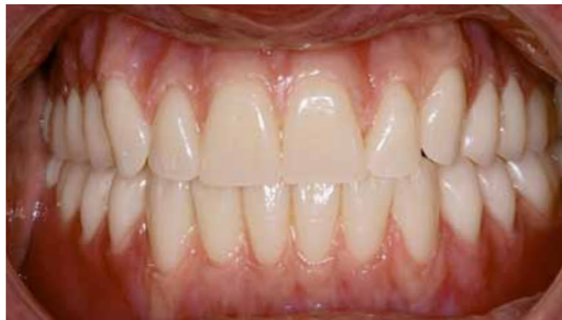
Les restaurations en bouche