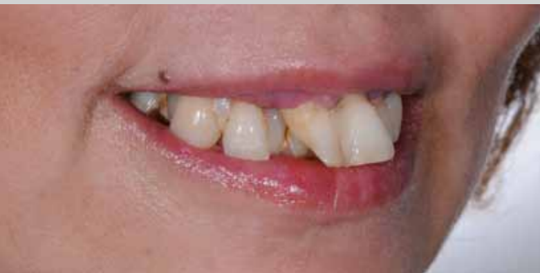
Le sourire de la patiente, avant traitement