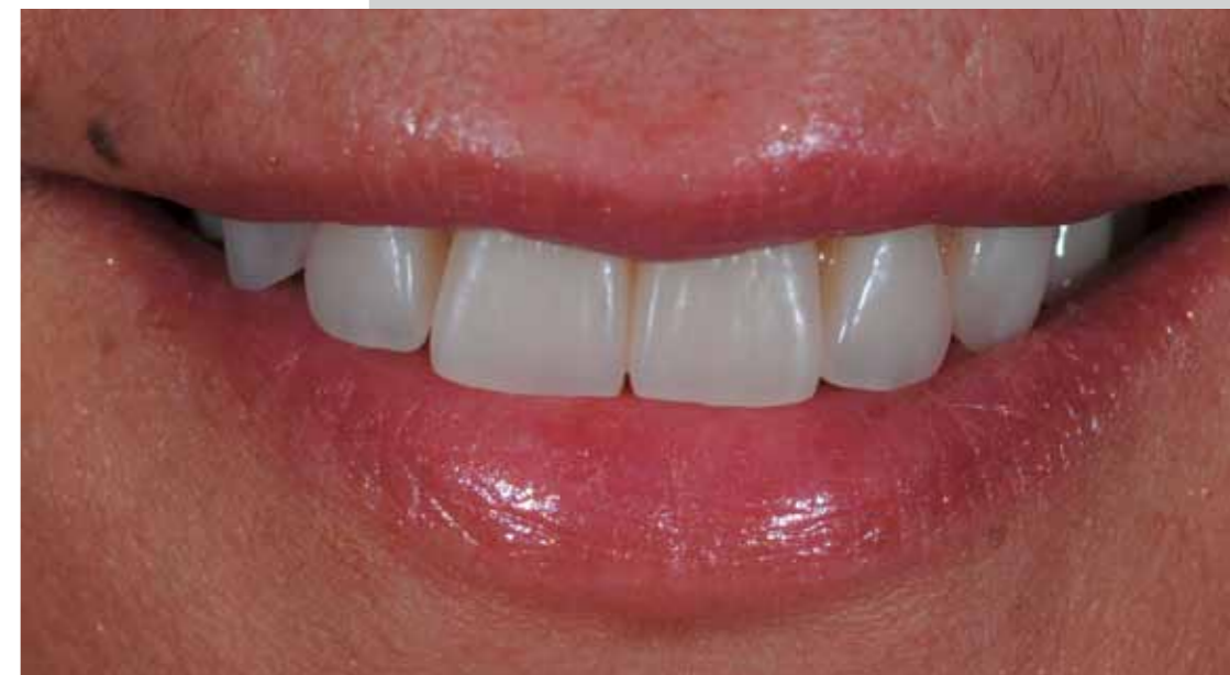
Un sourire harmonieux