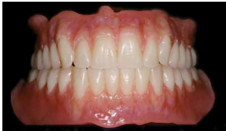
Les nouvelles prothèses avec caractérisation des gencives pour un effet naturel