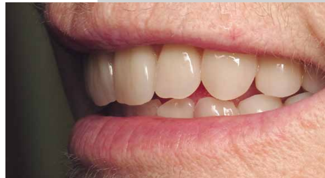
Le nouveau sourire