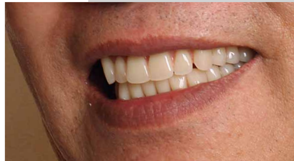
Soutien des lèvres et rajeunissement du sourire