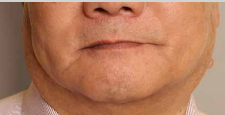
Avant traitement, les lèvres sont affaissées