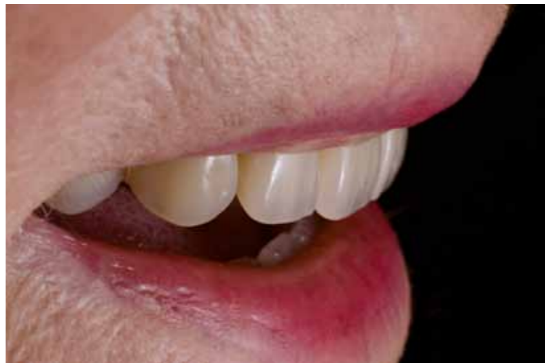
L'essayage en bouche