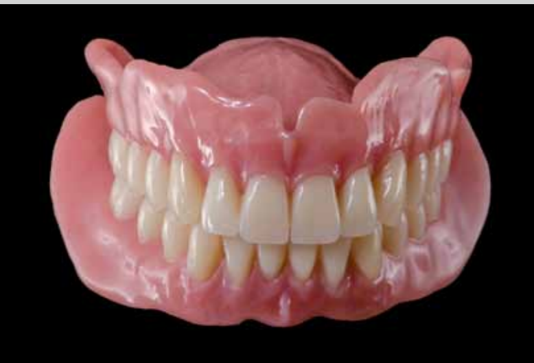
Les prothèses avec des dents adaptées au visage de la patiente