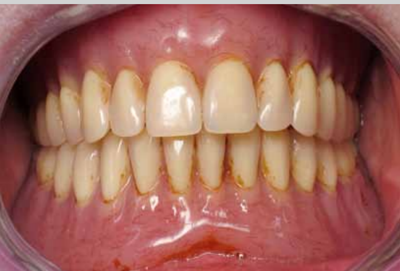
Les anciennes prothèses