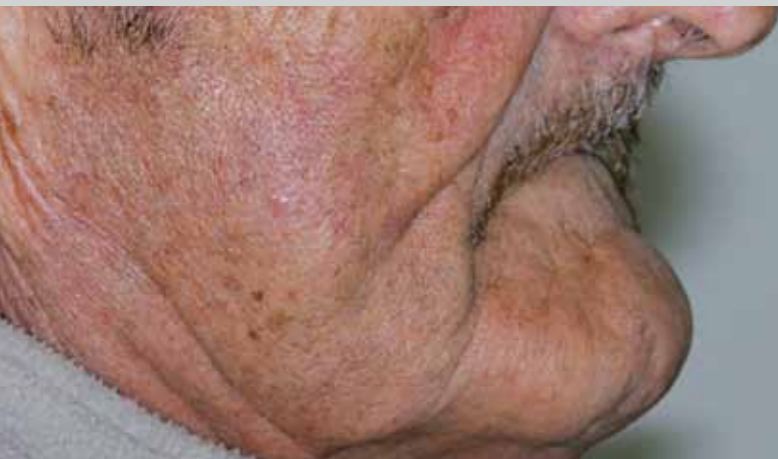
Avant traitement, manque de soutien prononcé des lèvres